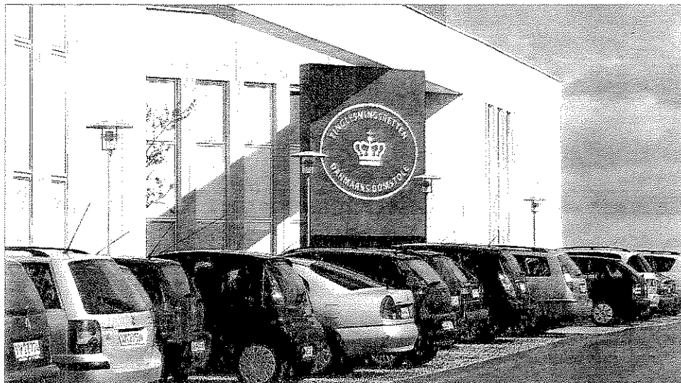
Enorme tekniske problemer gav månedlange ventetider, da Tinglysningens retten i Hobro blev digitaliseret. Det kostede tusindvis af boligejere dyre renter.

- Fri proces er særligt velegnet til netop denne type af sager, idet der ikke er nogen minimumsgrænse for tabets